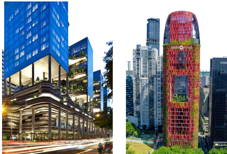
Gambar 1. Contoh penerapan biofilik desain

Berdasarkan eksplorasi kasus seperti desain fasad hijau pada wilayah tropis yang sudah di terapkan di Singapura pada Hotel Parkroyal Collection Pickering dan Oasia Hotel Downtown, ditemukan tipologi desain fasad responsif iklim tropis: