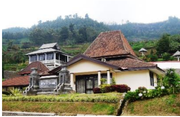
Gambar 2. Museum Kailasa Bangunan 1