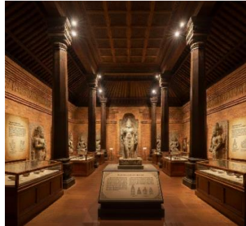
Gambar 8. Implementasi Fase Klasik Hindu