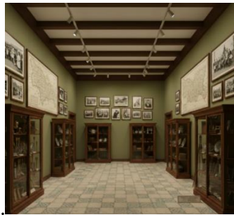
Gambar 9. Implementasi Fase Era Kolonial

Fase ini menggambarkan periode saat bangsa Eropa mulai memetakan dan meneliti reruntuhan Candi Dieng melalui penataan ruang bergaya laboratorium atau perpustakaan klasik. Koleksi berupa peta tua dan sketsa dipamerkan secara apik di dalam lemari kaca berbahan kayu jati gelap, yang berpadu serasi dengan lantai tegel bermotif untuk memperkuat kesan historis. Keseluruhan ruangan diterangi oleh cahaya warm white yang merata, menciptakan suasana dokumentatif sekaligus nostalgia yang mendalam