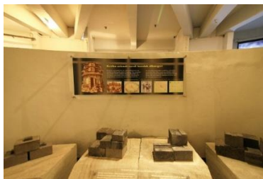
Gambar 5. Interior Bangunan Kedua