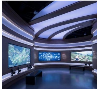
Gambar 11. Implementasi Fase Pariwisata dan Konservasi Kawasan Dieng

Fase ini menonjolkan masa pelestarian budaya dan pesatnya perkembangan pariwisata di Kawasan Dieng melalui desain modern minimalis dengan dinding lengkung yang terinspirasi dari alat musik Bundengan. Ruang ini mengombinasikan material kontemporer seperti kaca, logam ringan, dan panel akustik kain yang dilengkapi dengan area interaktif digital serta instalasi rambut gimpal yang digantung secara artistik. Keseluruhan suasana diperkuat oleh pencahayaan LED dinamis, menciptakan harmoni antara warisan tradisi dan kemajuan zaman yang visioner.