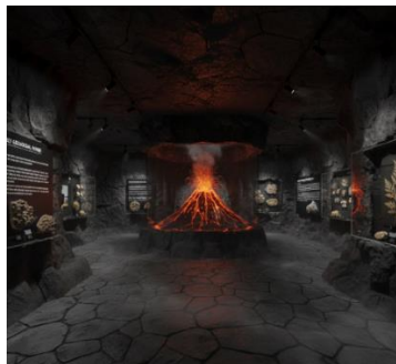
Gambar 7. Implementasi Fase Geologi Awal

Fase ini merepresentasikan aktivitas vulkanik purba pencipta kaldera raksasa Dieng melalui desain ruang bersirkulasi sempit dengan dinding asimetris yang menyerupai celah bebatuan belerang. Suasana kawah diperkuat dengan penggunaan material batu andesit kasar yang gelap, dipadukan dengan pencahayaan ambient jingga redup sebagai simbol magma serta efek uap air ( mist ) dingin untuk menciptakan pengalaman ruang yang imersif.