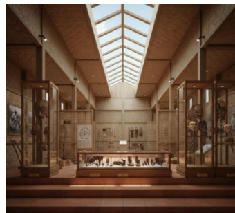
Gambar 10. Implementasi Fase Era Kehidupan dan Kesenian Masyarakat Dieng

Fase ini menggambarkan masa pemukiman luas masyarakat Dieng yang ditandai dengan munculnya komoditas kentang serta geliat seni budaya yang dinamis. Ruang pameran dirancang terbuka dengan sekat anyaman bambu ( gedek ) dan jalur sirkulasi berundak yang menyerupai terasering lahan pertanian, serta dilengkapi area khusus untuk koleksi kesenian. Penggunaan material alami seperti bambu, kayu ringan, dan tanah liat yang dipadukan dengan cahaya alami ( skylight ) menciptakan kesan kehidupan agraris yang segar dan autentik.