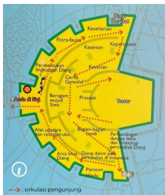
Gambar 6. Denah Museum Kailasa Bangunan Baru

Berdasarkan denah bangunan Museum Kailasa yang baru, penerapan alur cerita ( storyline ) diwujudkan melalui penataan ruang pameran yang tersusun secara sekuensial dan terarah. Denah dirancang untuk membentuk jalur sirkulasi yang jelas dan berkesinambungan, sehingga pengunjung diarahkan mengikuti urutan narasi sejarah peradaban Dieng tanpa mengalami kebingungan atau perpotongan jalur. Dari denah tersebut dapat dianalisis beberapa zona inti koleksi yang berisi :