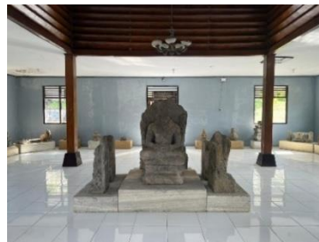
Gambar 4. Interior Bangunan Pertama

Bangunan pertama terinspirasi dari rumah adat Jawa Tengah, yaitu rumah joglo. Berdasarkan nilai historikalnya, rumah Joglo berpotensi menjadi salah satu cagar budaya di Pulau Jawa yang perlu dilestarikan. Cagar budaya merupakan warisan kekayaan budaya yang dimaknai sebagai lambang dari kehidupan manusia yang memiliki arti penting dari sisi sejarah, ilmu pengetahuan, serta kebudayaan dalam kehidupan bermasyarakat (Pratama et al., 2018). Keterhubungan bentuk bangunan pertama Museum Kailasa yang mengadopsi bentuk rumah joglo dengan fungsi penyimpanan koleksi arca didasarkan pada kesamaan nilai sebagai cagar budaya yang perlu dilestarikan. Pada bangunan ini menyimpan berbagai arca, mala , makara, kemuncak atau atap candi, lingga dan yoning, tungku untuk menaruh sesaji, nandi atau tunggangan Dewa Syiwa dan Dewi Durga yang bertubuh singa dan berkepala sapi, mahakala , batu penutup, kinara kinari (mahluk khayangan), dan siva trisirah atau Dewa Syiwa yang memiliki tiga wajah. Semua benda yang disimpan di bangunan pertama merupakan bagian dari candi-candi yang ada di kawasan Dataran Tinggi Dieng. Benda-benda tersebut disimpan di museum ini demi alasan keamanan atau tidak ditemukan posisinya dalam bangunan candi.